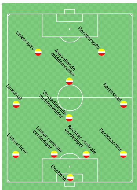
4-4-2 (met ruit)